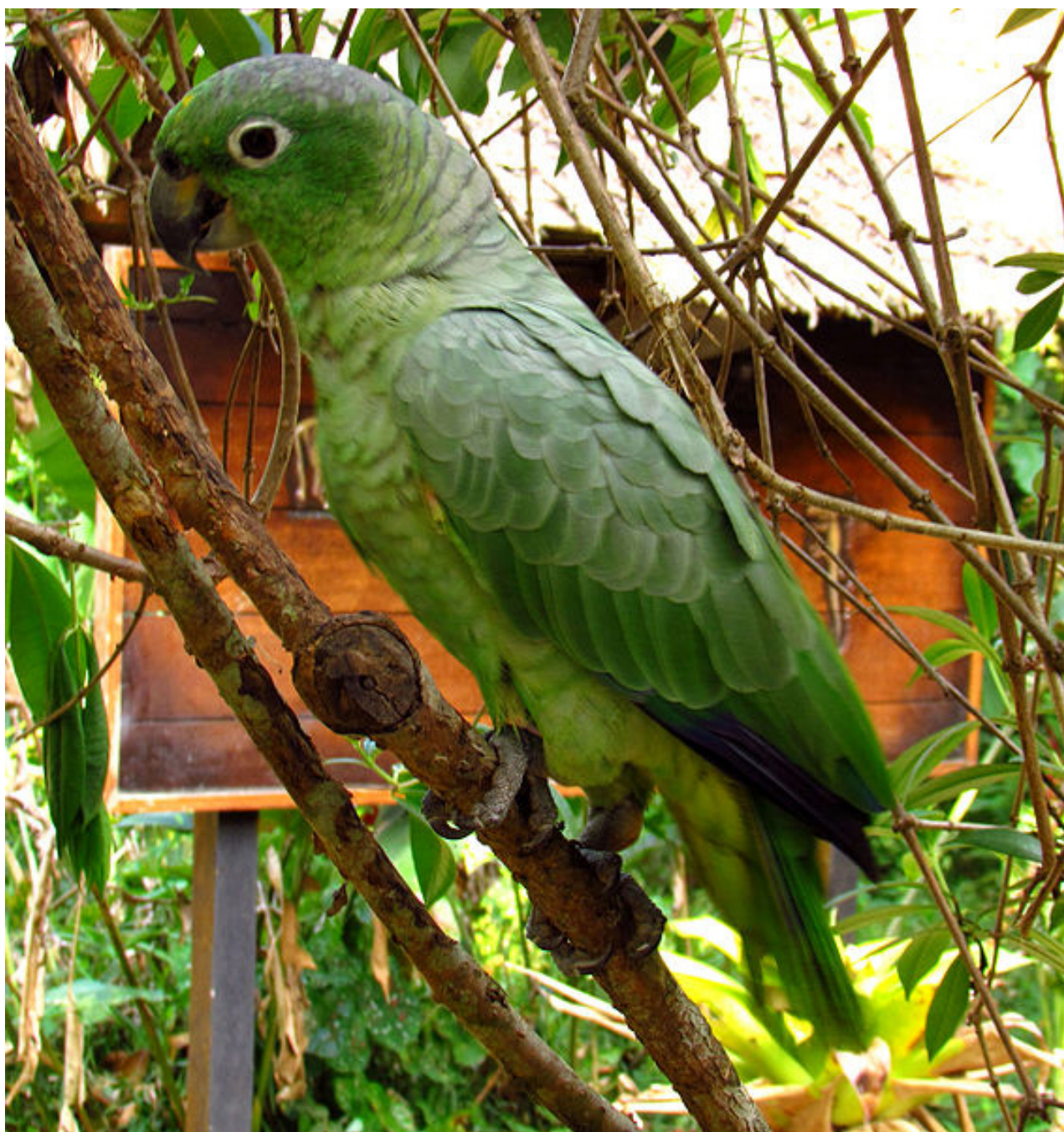
Amazona farinosa chapmani peruviana

In Colombia nella Regione dell'Orinoco è chiamata Lora mojosa , ed in zoonimia indigena nella famiglia linguistica Huitoto, della regione Araracuara nel sud Colombia "Cùyùque"; In Perù Loro ceniciente , o "Hullpa-loro"; in Bolivia Loro burron e in Ecuador Lora choronquera .