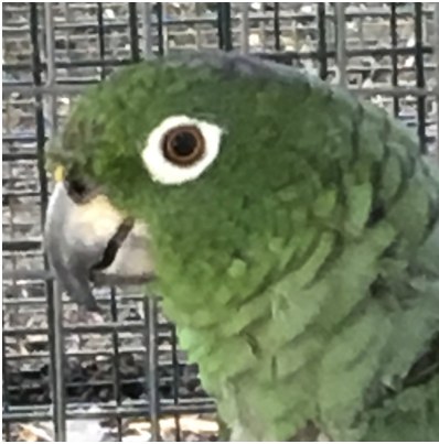
A. f. chapmani