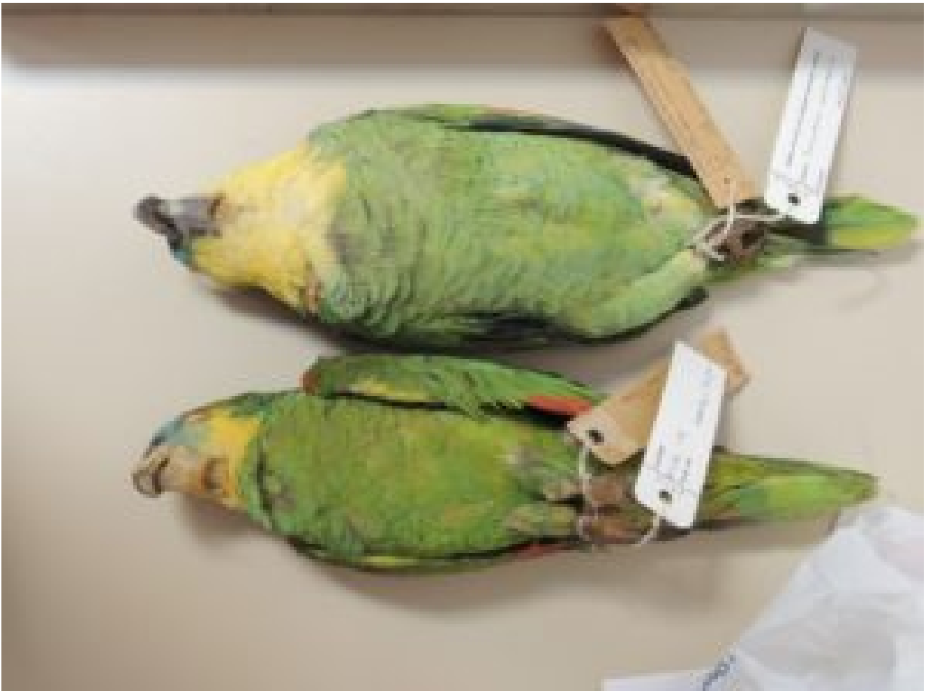
Un confronto tra aestiva e xanthopteryx .

Sulla base di attuali presidi tassonomici, per Auá ad essere considerato come una specie valida e distinta da aestiva , avrebbe dovuto venire a contatto con aestiva e non ibridarsi. A titolo di esempio, Amazona ochrocephala e Amazona farinosa entrano in contatto all'interno di parti della loro gamma, ma sono chiaramente specie separate perché non ibridano. Sottospecie, tuttavia, possono attraversare quando entrano in contatto tra loro.