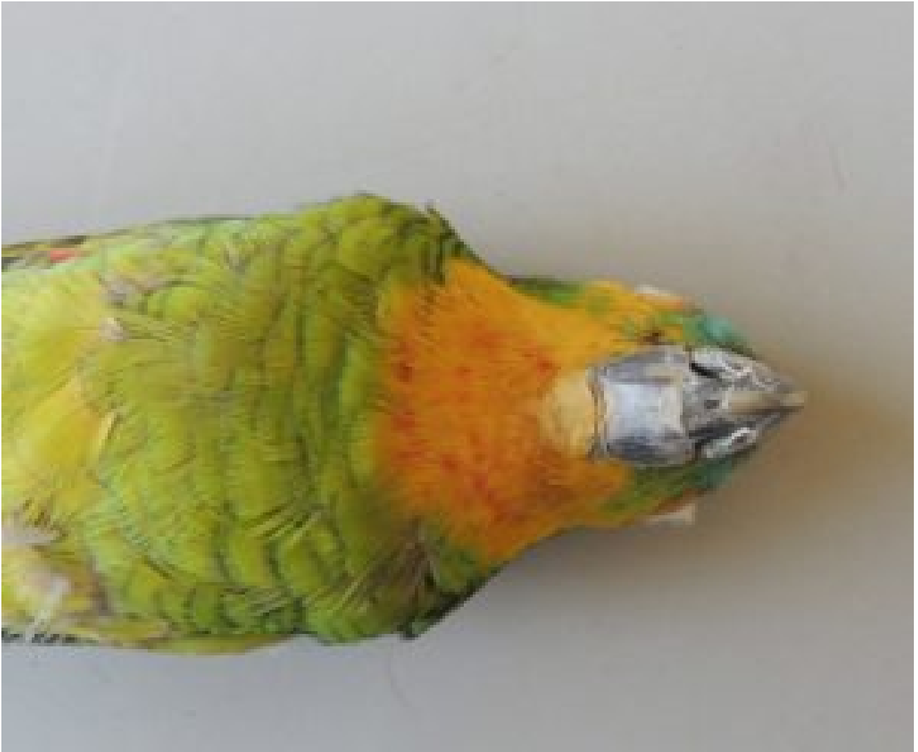
Maschio AUA raffigurante la gola tipico rosso.