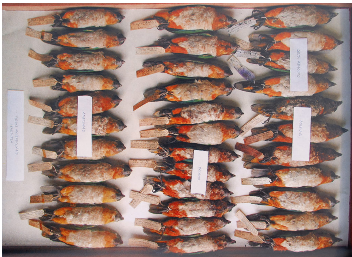
Pionites del Venezuela, delta amacuro e bolivar, si noti le varianti del colore arancio

tuttavia che ulteriori studi dimostrino in modo inequivocabile che la supposta presenza di ibridi in natura sia possibile, solo in caso di esemplari conspecifici, dato che le variazioni all'interno di entrambe le specie ; ad esempio, in cattività alcuni esemplari anziani di P.m. melanocephala , presentano alcune penne arancio sul vertice, che potrebbero essere naturali e non essere conseguenza di ibridazione.