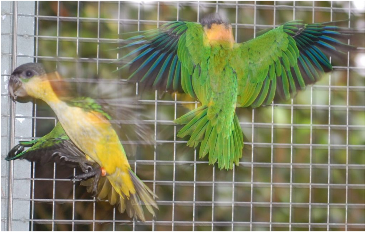
Giovani di Pionites pallida appena involati (allevamento G. Petrantoni)

Ala 133-147 mm; coda 66-75 mm; becco 21-28 mm; tarso 17-19 mm. (Forsaw, 1973)