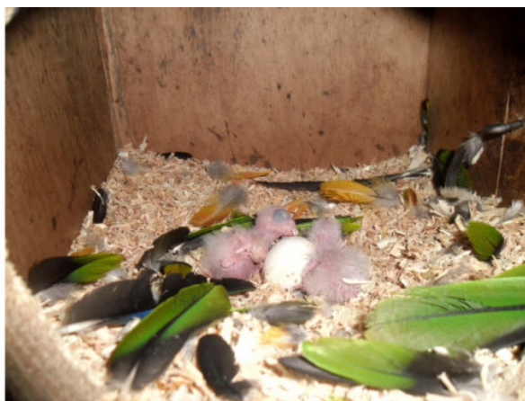
Due nidiate di Pionites di diverse età (allevamento S. Micheloni)

Fronte, parte anteriore del vertice, parte superiore delle redini e inizio della parte posteriore del collo nero lucido; piccola macchia verde smeraldo brillante tendente al blu sulla parte inferiore delle redini e davanti alla parte superiore delle guance; parte inferiore delle guance, gola, lati del collo e striscia lungo il fondo del retrocollo arancio albicocca pallido. Parti superiori verde brillante. Copritrici primarie blu violaceo con sottile bordo verde lungo il vessillo esterno; penne giallo sporco sulla regione carpale; resto delle remiganti verde. Remiganti primarie con vessillo esterno blu violaceo. Sottoala con copritrici verdi. Petto e centro del ventre bianco sporco con sfumatura color crema e / o gialla; lati del ventre, calzoni, zona pericloacale e sottocaudali arancio albicocca. Sopraccoda verde con sottile punta gialla; sottocoda di tonalità più spenta e più scura. Parti nude: becco grigio antracite scuro; cera grigia; pelle nuda grigio piombo sulla regione perioftalmica; iride rossa; zampe grigio piombo.