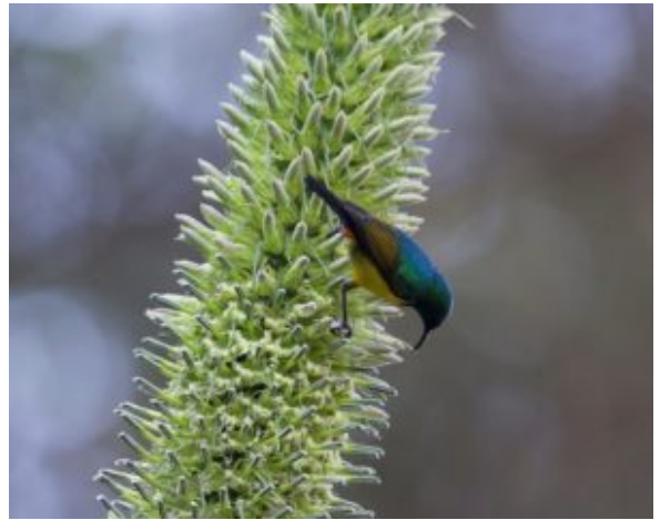
Tangara regia su Lobelia aberdarica

aprile e agosto, in funzione della località di deposizione o del versante montano.