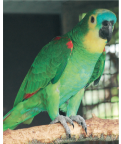
Tipica Amazona aestiva Bahia femmina proveniente dall'est del Brasile (allevamento Petranconi)

A quanto sopra detto si aggiunga che l'area distributiva della amazzone fronte blu è valutata dal nord est del Brasile al Paraguay e poi ancora sino alle estreme regioni del centro nord dell'Argentina.