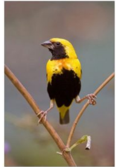
tessitore testa nera

Il segreto per avvistarli è di ricercare prima di tutto il loro albero preferito ( Podocarpus ) nella stagione di fruttificazione, essendo frugivoro per il 90% della dieta, mentre per la rimanente percentuale si nutre di foglie, di altri fiori e frutti ( Galiniera , Musanga , Olea ). Costruisce il nido tra i bamboo a 3 metri da terra e forma una piattaforma alla stregua di quelle dei piccioni, con la deposizione di un uovo tra maggio e settembre.