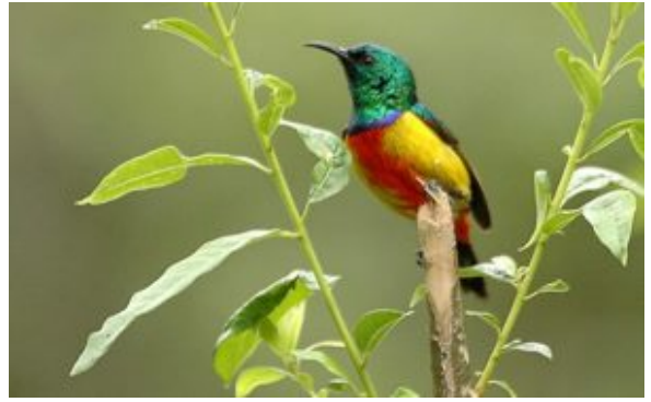
La nettarina regia tra il fogliame sul versante montuoso ugandese.

Ogni goccia d'acqua che ha origine dai monti Ruwenzori appartiene al Nilo e la pioggia cade formando migliaia di piccoli ruscelli che scendono a valle. Alla fine tutta l'acqua si riversa dalle regioni alpine verso una grande foresta montana, sotto i 4000 metri e i ruscelli di montagna ne lambiscono gli alberi nodosi che sono ricoperti da licheni e muschi. Il paesaggio è ricoperto di erica, tanto da rendere il luogo una foresta da fiaba. Qui vive il rarissimo Cefalofo dalla fronte nera ( Cephalophus nigrifrons rubidus ), animale timido e sfuggente.