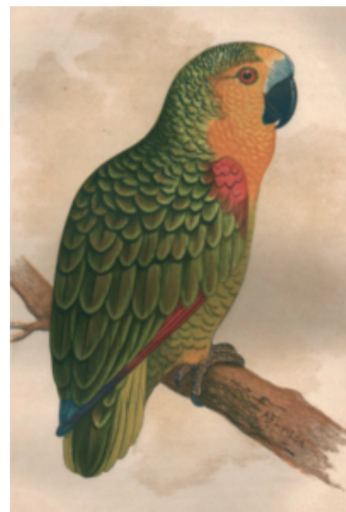
Amazona aestiva brasiliiana (dipinto di A. Flydon, 1900) tratto da: Speaking parrots, dott. K. Russ

ha portato ad accentuare il giallo delle ali e il giallo del petto e del capo, modificandone la taglia, quasi come le amazzoni oratrix, falsando ciò che la natura a fatica aveva selezionato.