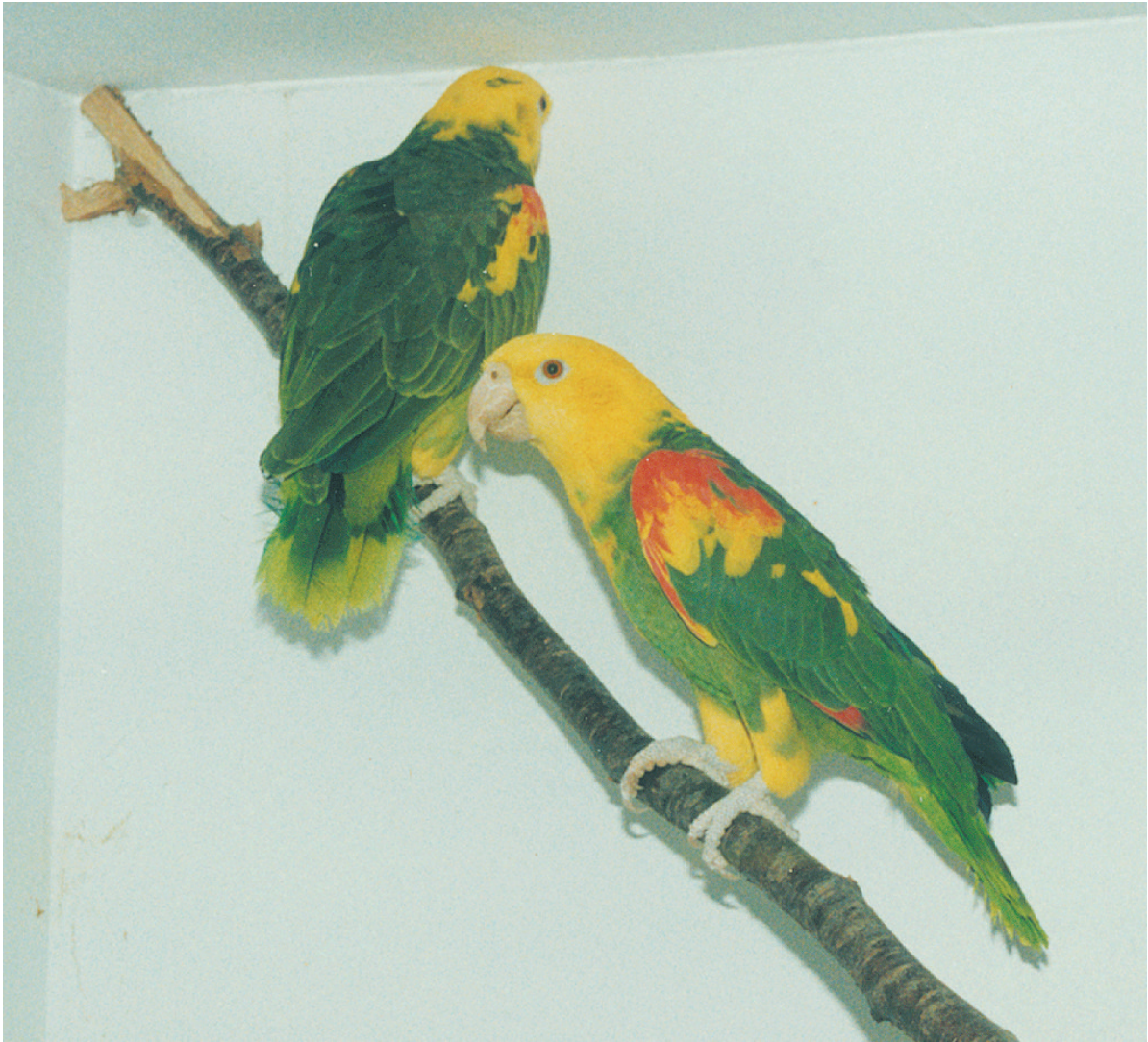
Coppia riproduttrice di Amazona o. oratrix (magna) del Dott. Muggiasca