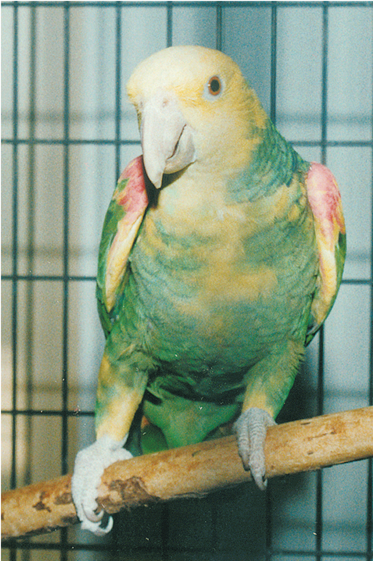
Amazona o.tres Marias,Una femmina adulta , con minore