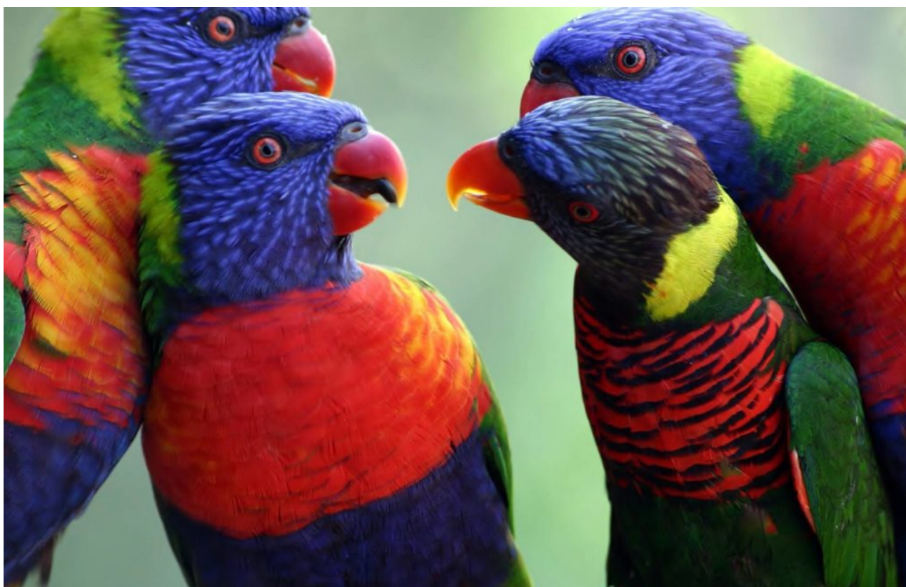
Lorichetti – arcobaleno

Nei lorini, che si nutrono in prevalenza di nettare e di polline, la lingua è dotata all'estremità di una serie di papille setiformi erettili che facilitano la raccolta del cibo, soprattutto il polline, e ha valso loro l'appellativo di pappagalli dalla lingua a spazzola. Queste papille si drizzano automaticamente in avanti quando la lingua viene estroflessa e si ripiegano su sé stesse, scomparendo, quando essa viene retratta o quando deve "manipolare" particelle più consistenti, come bacche.