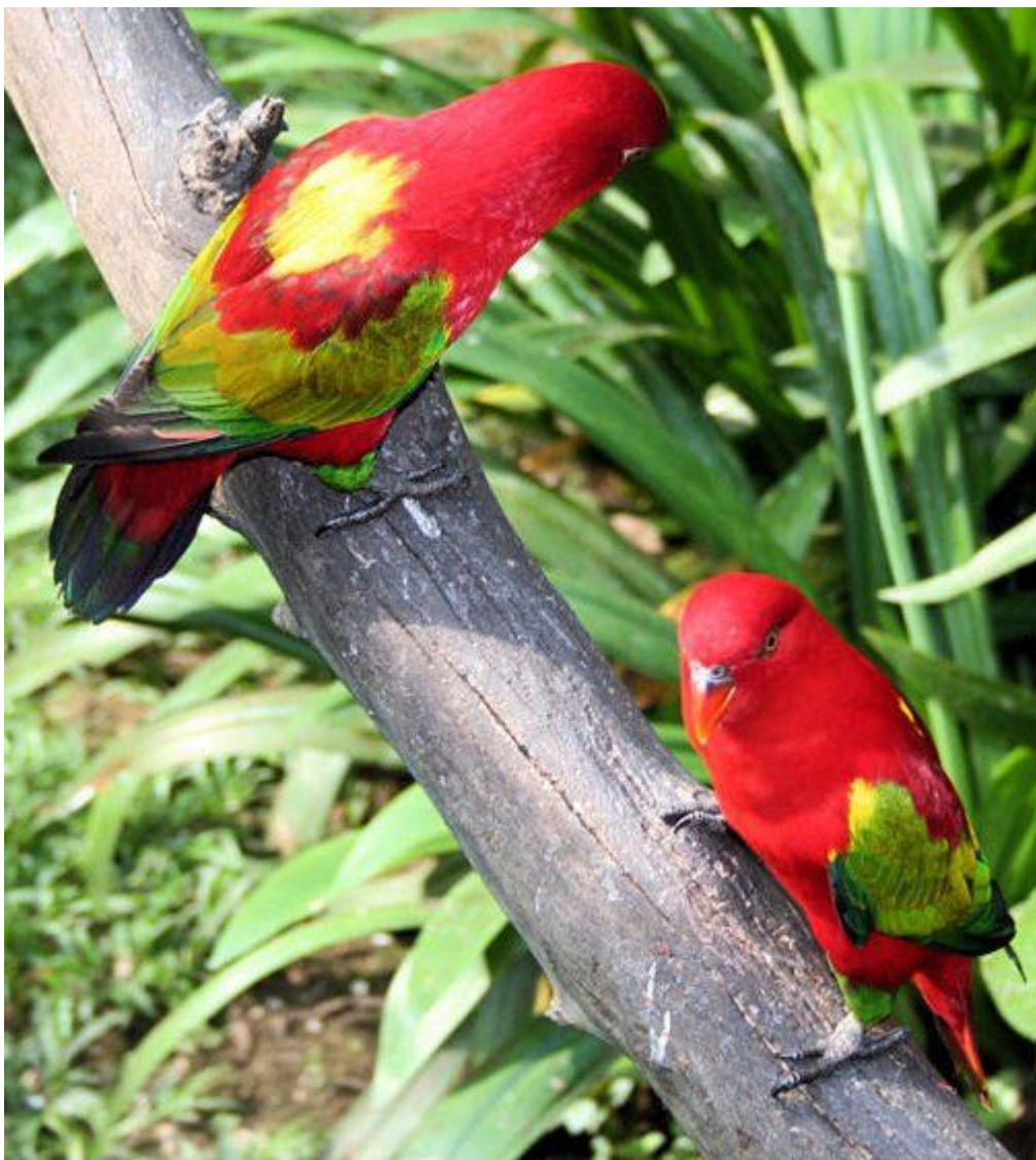
Yellow-backed Lory ( Lorius garrulus flavopalliatu )