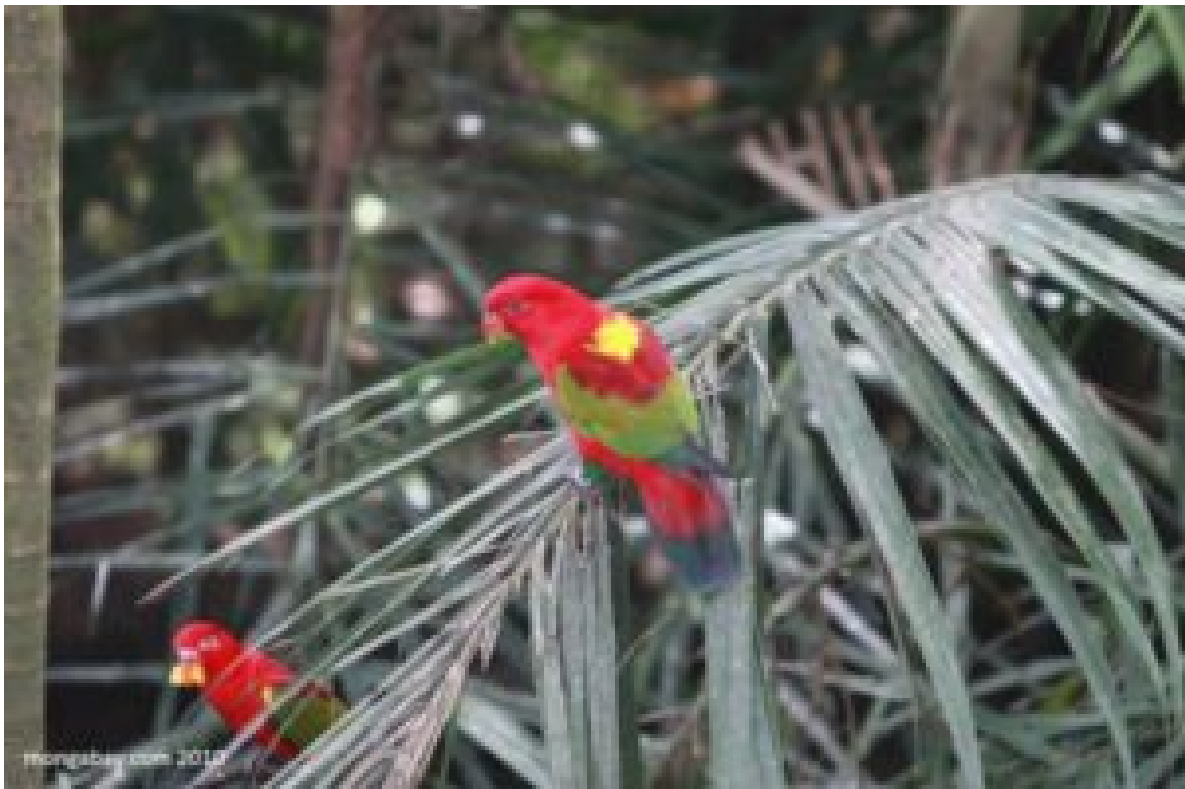
Lorius garrulus flavopalliatu

La Garrula, come tutti i Lori , ama fare il bagno, anche d'inverno, riuscendo a sopportare temperature sino a -4^{\circ} C, con escursioni diurne sino a +15 , bisogna comunque porre attenzione se qualche soggetto mostra segni di arruffamento e causa di frequenti variazioni di temperatura, pertanto è utile porlo all'interno. A tal proposito si ricorda che nelle zone equatoriali, le ore di giorno sono 12 e quindi, se all'interno, bisogna rispettare le ore e le temperature.