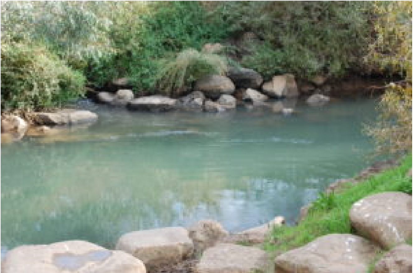
Il fiume Giordano Israele

Viaggio tranquillo, indescrivibile la gioia e l'emozione che mi invase all'atto dell'avvicinamento a questo estremo lembo di terra che si affaccia sul Mediterraneo e sul Mar Rosso, pur essendo Asia. Non è minore la sorpresa che, quasi ad un tratto, senza passaggi gradualmente, ci si trova trapiantati dall'Europa in un paese Asiatico. Una brezza serale, tiepida e satura di aromi - per quanto vi fossero 24° - rendeva piacevole il profumo delle aiuole in fiore e degli alberi di palma, colme di datteri.