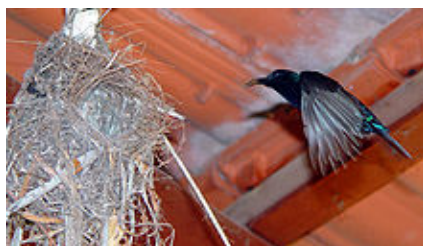
Nettarina al nido . . . .sotto casa

La città è costituita da grandi strade che si tagliano ad angolo retto e sono ombreggiate da alberi di ficus; sui lati sono costruite, in mezzo ai giardini, graziose villette d'epoca , sollevate dal piano terra con un solo piano sovrastante.