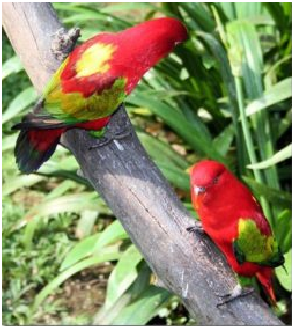
Yellow-backed Lory ( Lorius garrulus flavopellatus )