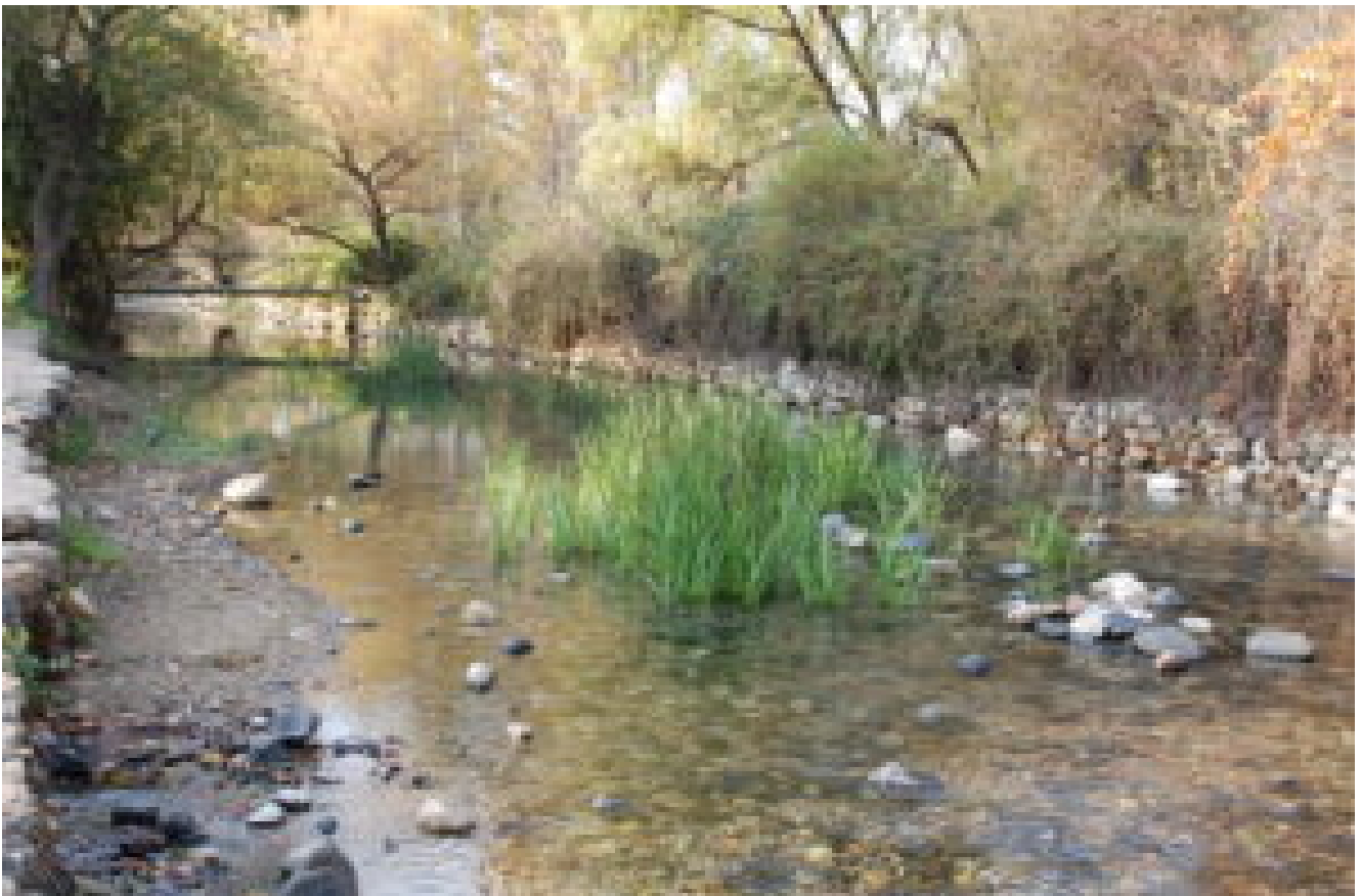
Le sorgenti del Giordano Israele

La sorpresa più grande e' nei prati: con assoluta indifferenza, le upupe ( Upupa epops ) continuano a beccare , alla ricerca di piccoli insetti, come anche e' consuetudine da noi.