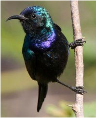
Nettarina palestinese maschio , nei pressi del fiume Giordano