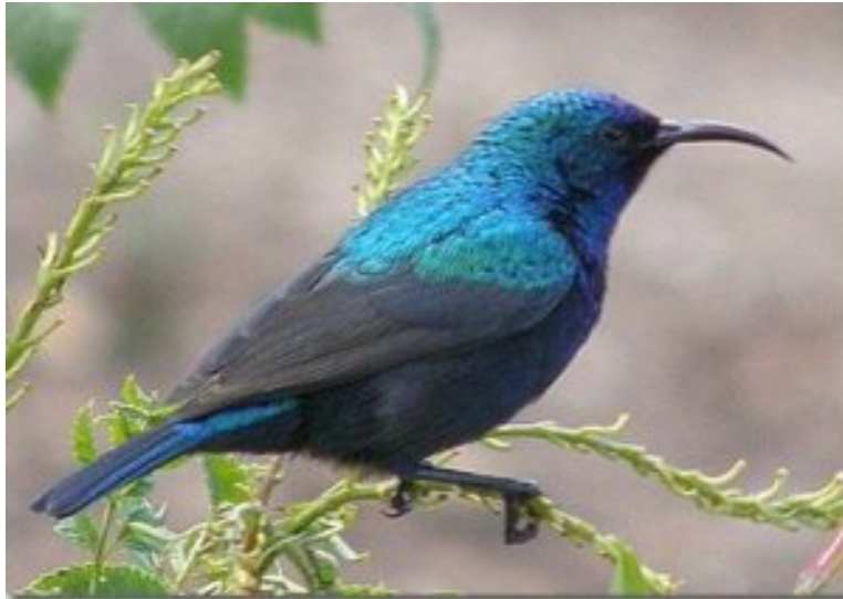
Nettarina maschio vicino

Ci si avvia verso il mare di Galilea, allorquando il deserto comincia a far sentire il suo “respiro” da gigante, nel raggio di chilometri l’unico segno di vita è qualche piantagione di palme.