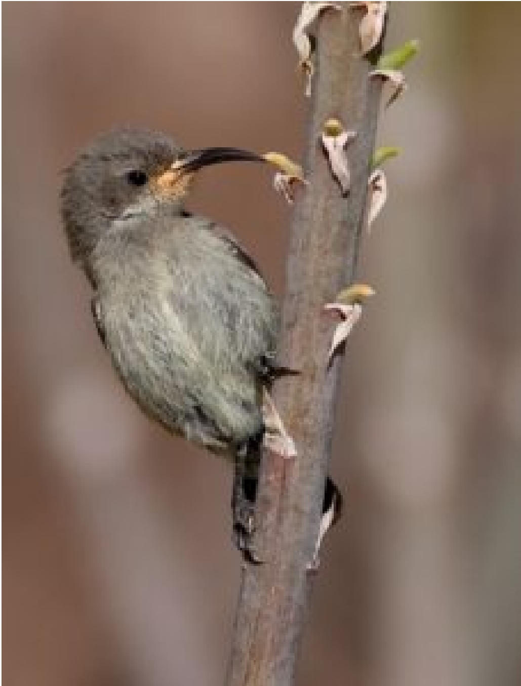
Nettarina osea femmina

Giunti al lago di Tiberiade , visitati i luoghi sacri che hanno fatto la storia e sul finire della giornata ,inizia il tramonto ; il sole inizia ad assorbire i colori del deserto e diventa luce allo stato puro,liquida , dorata,quasi irreal