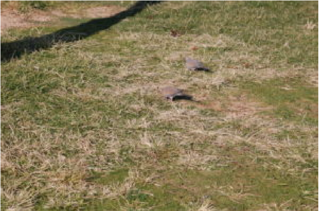
Tortore africane in natura