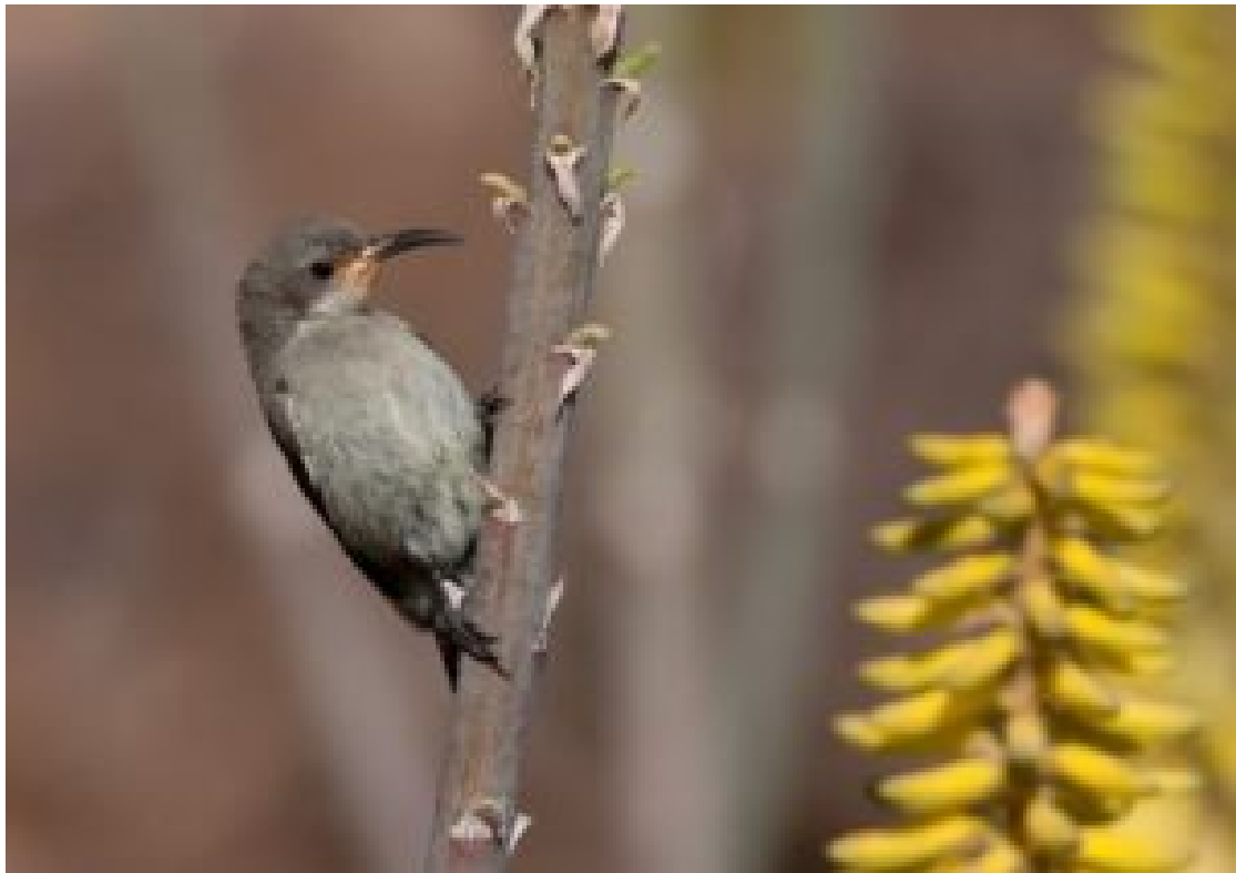
Nettarina alestinese femmina

Nel folto delle siepi ho intravisto e cliccato una piccola e deliziosa Erythropigia galactotes , ma purtroppo nell'ingrandire il fotogramma, l'immagine si è sgranata, la forma è visibile ma non i particolari.