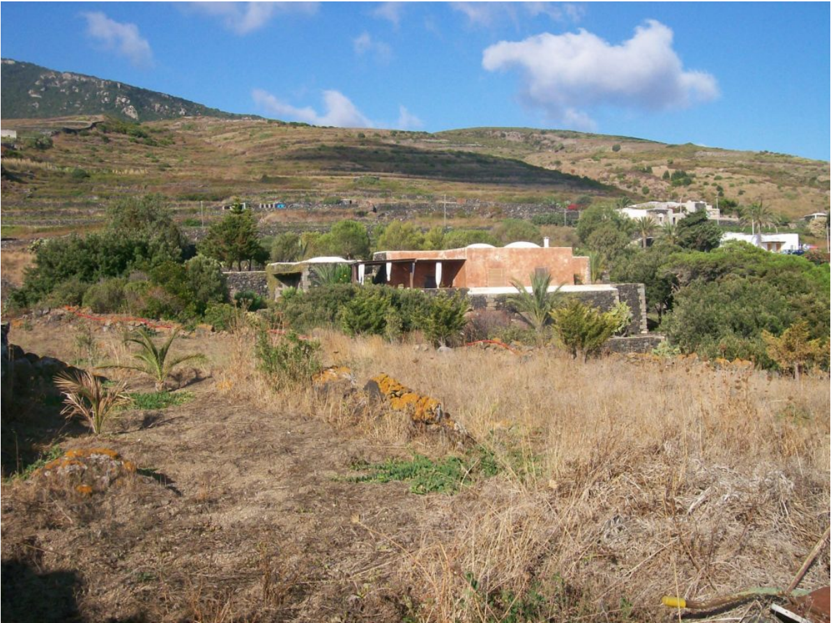
La macchia mediterranea, sullo sfondo Montagna Grande. Località Mueggen.(est isola)

Nessun ramo della storia naturale è stato dotato di una letteratura più ricca di quello dell'ornitologia, nuovi articoli