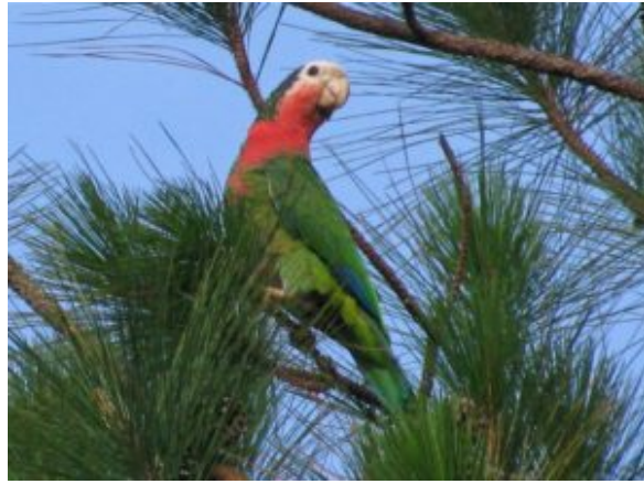
L'amazzone di Abaco frquentatrice della pineta a sud dell'isola

La cubana ( amazona leucocephala ) è specie politipica con 5 sottospecie riconosciute: A.l.leucocephala , Cuba; A.l.palmarum cuba occidentale e isola della Gioventù; A.l.caymanensis Gran Cayman; A.l.hesterna Cayman bracc e Al.bahamensis Bahamas, che negli anni addietro era presente su tutte le maggiori isole dell'arcipelago.