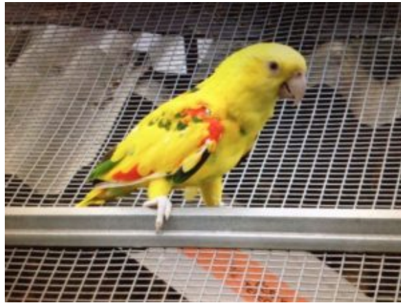
amazona oratrix gialla

traffico di commercializzazione. Stessa sorte in tempi più recenti è toccata alla Amazzone a testa gialla, molto più richiesta da commercianti e allevatori.