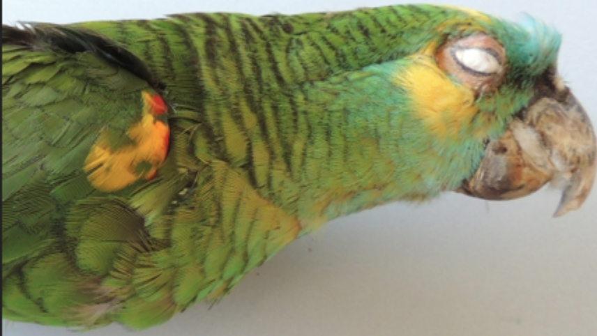
Forma del Nord che mostra po 'di colore testa