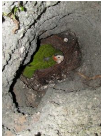
Uno scatto notturno al nido , con la presenza della mamma.

La sua alimentazione, specialmente durante la stagione riproduttiva, varia da frutti , semi e fiori di circa diciotto specie presenti.