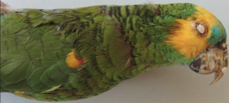
Forma del sud che mostra più colore