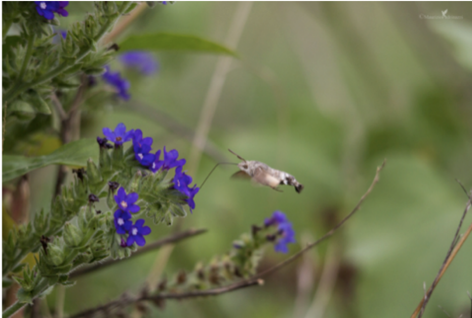
Macroglossus stellatarum, così detta Sfinge simile per movimento al colibrì.

Aggiungo la notizia di una curiosità scientifica accaduta di recente: un mio amico ha riferito che, mentre stava lavorando all'interno di un capannone riscaldato, notò, a suo dire, un "colibrì" che, col tipico volo, cercava una uscita dalla finestra. Mi sono stupito e, sebbene avessi più volte ritenuto il fatto impossibile, ho profuso tutte le mie conoscenze del campo per tentare di giungere a una spiegazione.